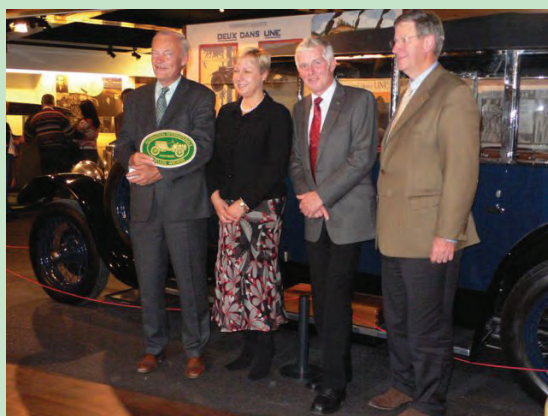
Ontvangst in de D'leteren Gallery van de leden van FIVA.

Neem ook eens een kijkje op de website van FIVA: www.fiva.org