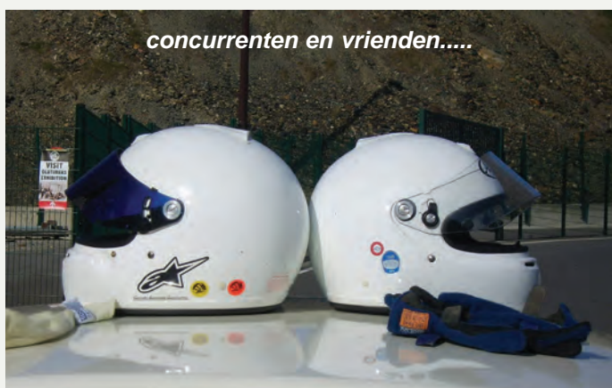
concurrenten en vrienden.....