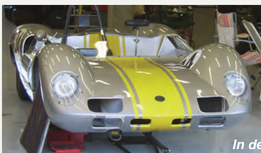
In de paddocks